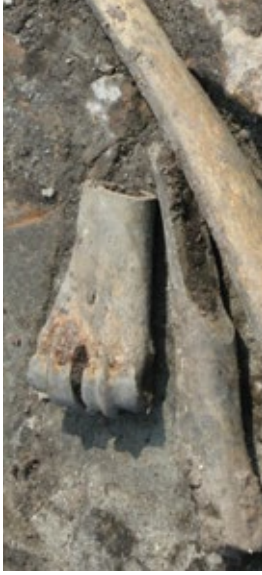
Stukken bot bovenop middeleeuwse bouwfragmenten.