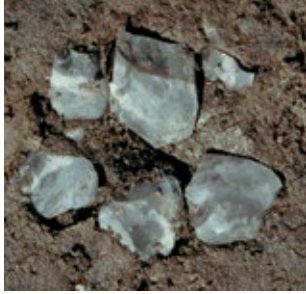
Concentratie vuursteenscherven. In de steentijd maakten mensen allerlei werktuigen van vuursteen, zoals messen, pijlpunten en bijlen.