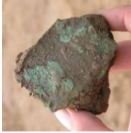
Metalen voorwerp met groene corrosie.