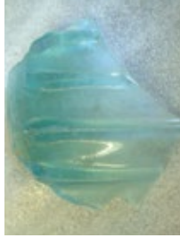
Scherf van een glazen beker uit de Romeinse tijd.