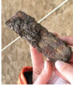
Metalen voorwerp met rode corrosie.