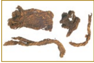
Stukken touw uit de jonge steentijd.