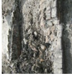
Bakstenen fundamente uit de 16de / 17de eeuw.