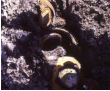
Middeleeuws aardewerk in een humeuze grond.