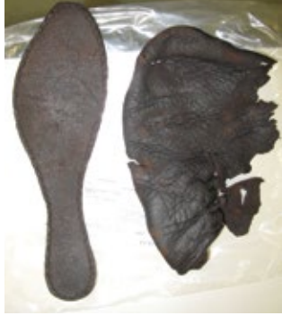
Delen van middeleeuwse leren schoenen.