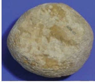
Maalsteen looper van natuursteen.