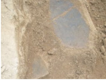
Scherven prehistorische aardewerk in een zandbodem.