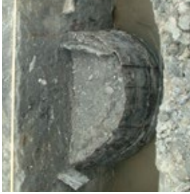
Deze houten planken vormden een waterput.