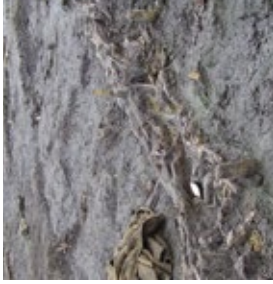
Resten van een wand gemaakt van houten vlechtwerk.