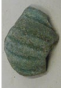
Deel van een Romeinse kraal van glas.