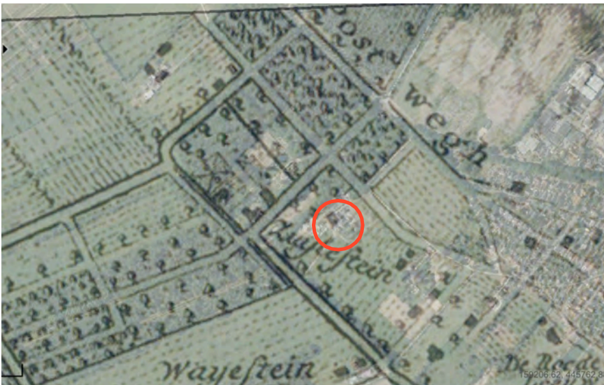
Figuur 1: de historische verhouding tussen landgoed en agrarische erf bebouwing

Door een historisch sterk verweven relatie van het agrarisch erf op het landgoed dient deze erfrelatie geïnterpreteerd te worden in samenhang met de hoofdbebouwing van Zuylestein. Het agrarisch bedrijf is door een langdurig en zelfs historisch verweven ligging, een visueel herkenbaar onderdeel van het landgoed ensemble (zie Figuur 1+2).