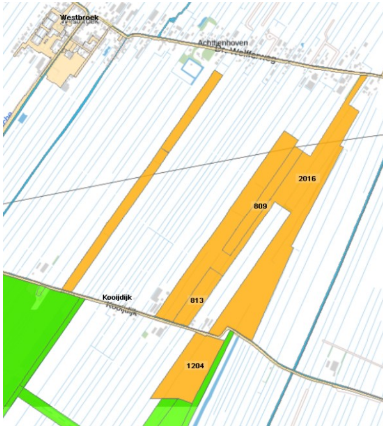
Figuur 2 In geel: het provinciaal bezit. De percelen 809, 813, 1204 en 2016 (gedeeltelijk) worden ingebracht in de kavelruil. Zie figuur 1 voor het gedeelte van perceel 2016 dat wordt ingebracht.