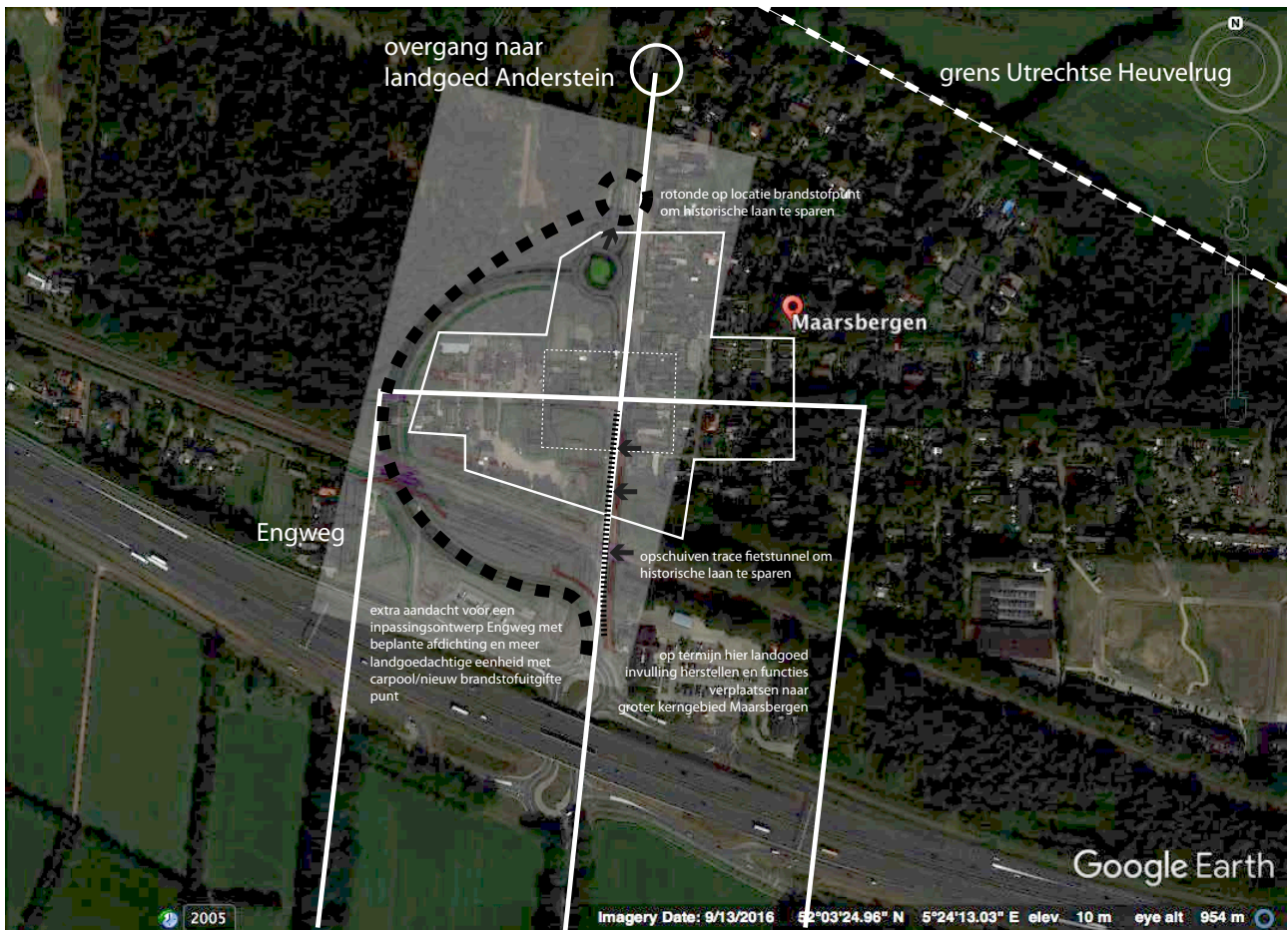
tekening 5: toetsing Westelijke variant met open Tuindorpweg