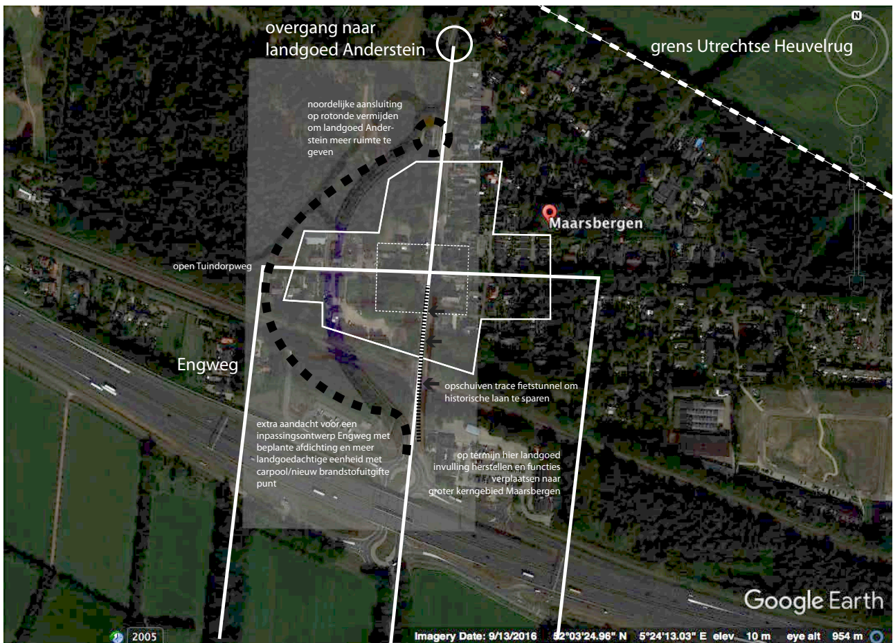
tekening 6: toetsing Bos-Beek variant