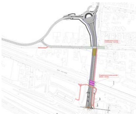
tekening 2, Dorpsvariant

Advies 1: volgend aan deze tussenconclusies, adviseer ik om niet verder te gaan met de Dorpsplan variant. Hierin kan de historische middenlaan niet behouden worden omdat deze wordt vervangen voor een ingrijpende verdieping en aanpassing van het wegprofiel door een tunnelbak. Er is helaas fysiek geen ruimte om een 'extreme historische gelaagdheid' te maken met zowel oude laanbomen als een nieuwe tunnel. De ontwikkelingsmogelijkheden voor een kerkplein zijn redelijk gunstig maar de ontwikkeling van een groter kerngebied is niet met genoeg eenheid in beplanting en gelijkblijvend maaiveld te maken.