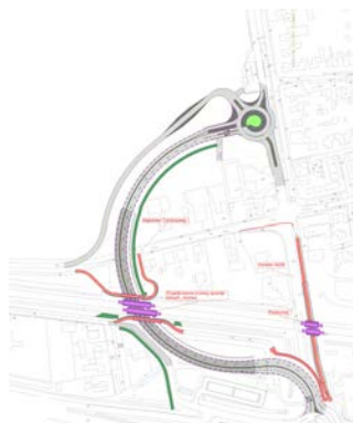
tekening 3, Westelijke variant met gesloten Tuindorpweg

Advies 2: verder adviseer ik om ook de Westelijke variant met gesloten Tuindorpweg af te laten vallen. Hier is niet genoeg continuïteit te maken in de Haarweg/Tuindorpweg. In plaats daarvan wordt de vanzelfsprekend doorgaande structuur afgesneden en kronkelt het fietspad op een onbegrijpelijke wijze van de historische route af. De Westelijke variant biedt wel kansen om zowel het plein als het groter kerngebied als een robuuste eenheid te ontwikkelen.