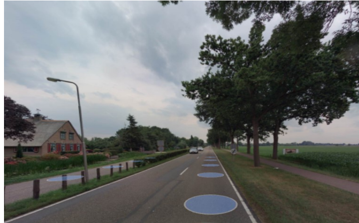
Figuur 1 N484 tussen A2 (noorden) en Leerdam (zuiden)