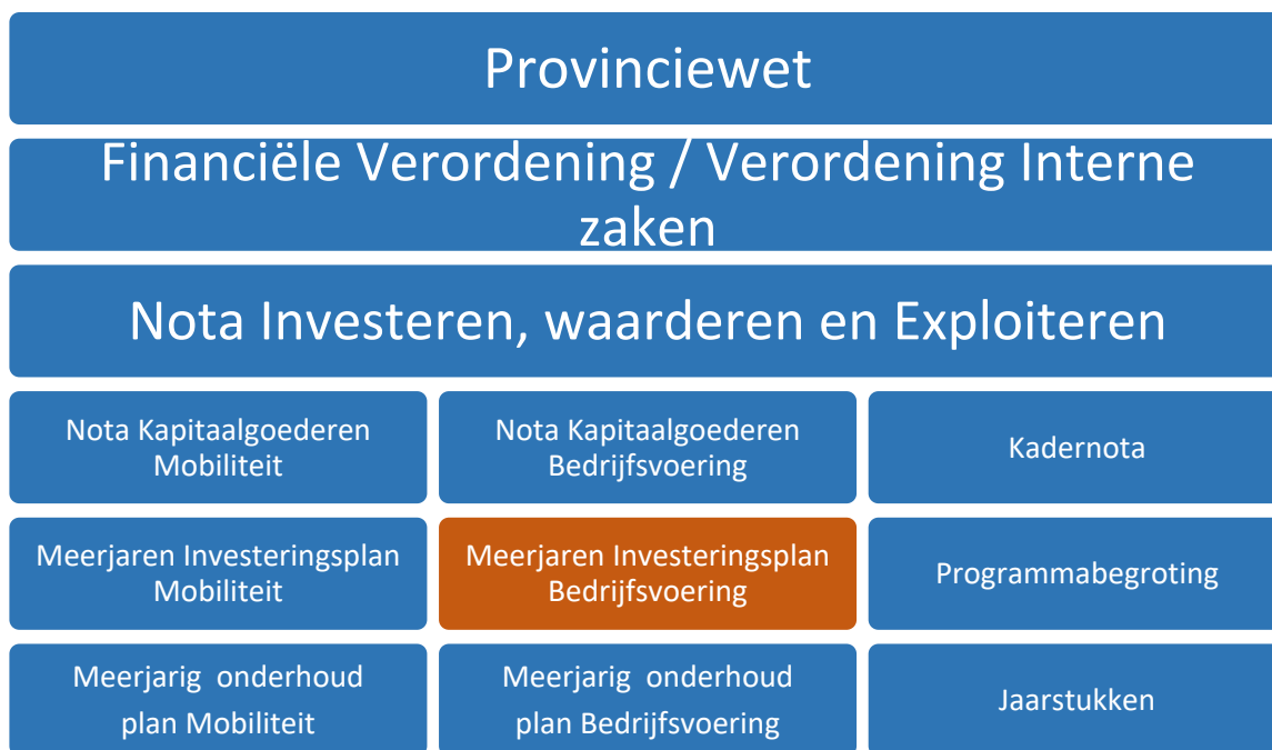
Figuur 1: Samenhang MIPB met wettelijke en provinciale kaders

Hierbij geeft de programmabegroting het financiële kader voor het lopende begrotingsjaar. Indien er verschillen optreden tussen de voornoemde nota's kapitaalgoederen, MIP's, MOP's en de (gewijzigde) programmabegroting dan geldt dat de Nota investeren een leidende rol heeft in de hiërarchie.