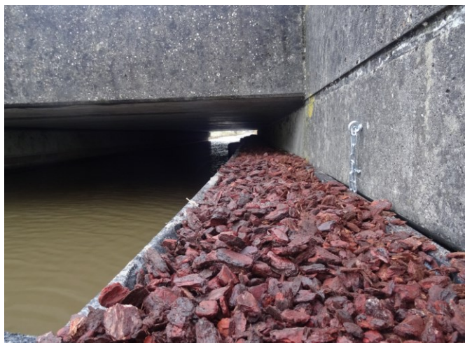
Op de twee rode stippen plaatste de provincie Utrecht otterpassages langs de N212 (Enschedeweg).