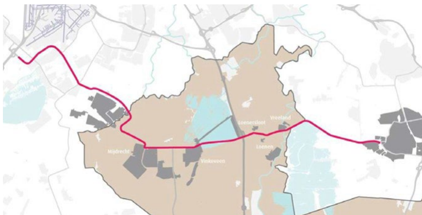
Figuur 1 Tracé N201 in de provincie Utrecht

Met dit statenvoorstel geven wij invulling aan deze opdracht en vragen wij u het voorkeursalternatief uit fase 3 met een uitvoeringskrediet van € 95.122.000 (excl. btw) te promoveren naar de voorbereidingsfase.