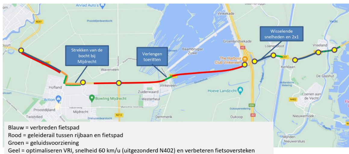
Figuur 3 Hoofdlijnen voorkeursalternatief fase 3

Het voorkeursalternatief op basis van de studie in fase 3 is op hoofdlijnen weergegeven in Figuur 3.