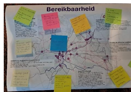
Praatplaat over het thema 'bereikbaarheid'

Belang van het borgen van vitaliteit voor de aantrekkelijkheid en levendigheid van (kleinere) kernen.