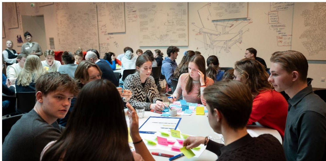
Bijeenkomst van Jong Utrecht Aan Zet