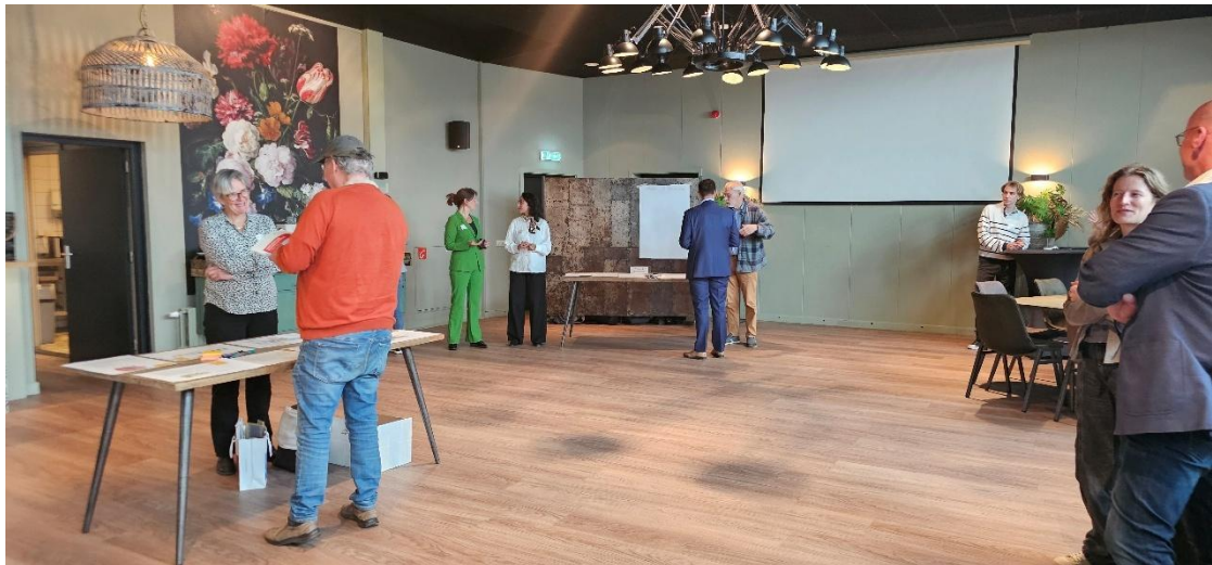
Informatiemarkt in Woerden