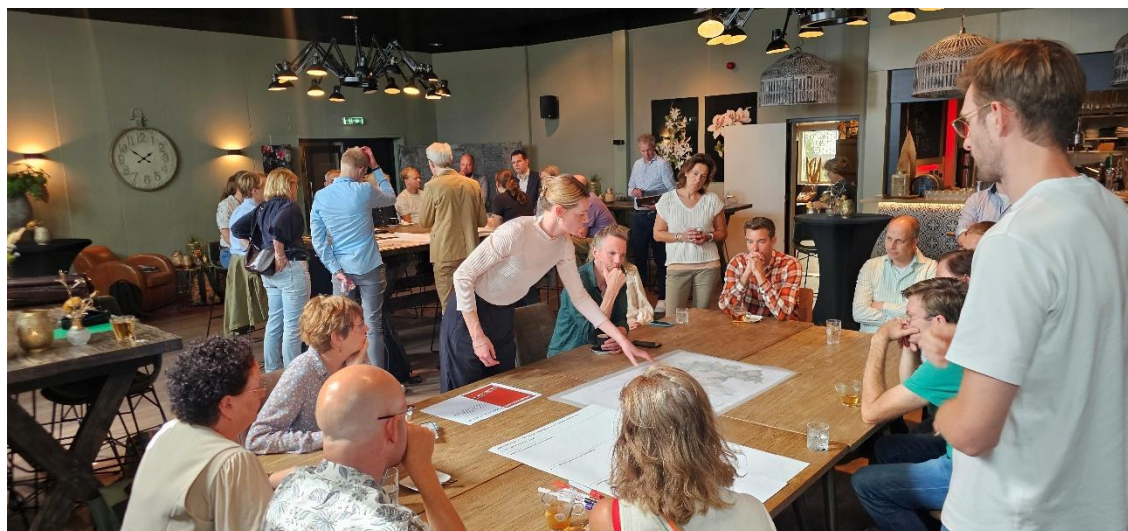
Gebiedsgesprek over het Groene Hart

Noodzaak van verduurzaming en extensivering (grondgebonden) landbouw in midden en zuiden Gelderse Vallei en aandacht voor sociaaleconomische aspecten.