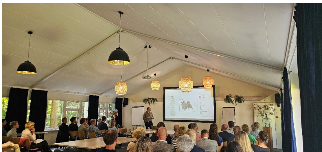
Gebiedsgesprek Utrechtse Heuvelrug, Kromme Rijngebied & Schalkwijk

In juli en september voerden we gebiedsgesprekken met gemeenten, waterschappen en een aantal maatschappelijke organisaties. Dit ging over de gebiedsparagrafen; onderdeel van een flink gewijzigd gebiedenhoofdstuk in de Omgevingsvisie waar gericht rekening gehouden wordt met de kwaliteiten en uitdagingen van de gebieden. Hier worden beleidskeuzes zichtbaar en de provincie kan daardoor scherpere keuzes maken over welke ambities in welk gebied moeten landen, onder meer op basis van de aanwezige kenmerken en kwaliteiten. Daarom is in het participatieproces extra ruimte gemaakt voor deze gebiedsgesprekken. Daarnaast was er ook ruimte voor de partijen om hun inbreng op de thematische wijzigingen in de Omgevingsvisie en -verordening mee te geven.