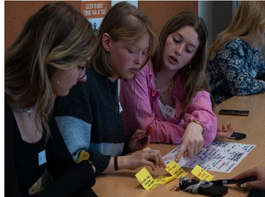
Foto's van de JUAZ bijeenkomsten bij o.a. Nimeto