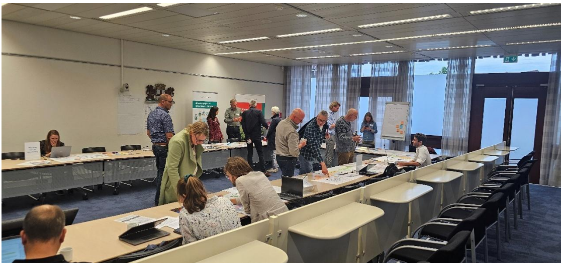
Informatiemarkt voor inwoners in Amersfoort