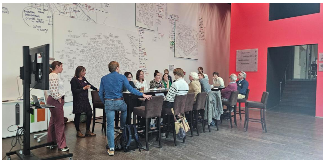
Foto van één van de gesprekstafels met maatschappelijke- en belangenorganisaties

Deze gesprekken leidden tot levendige dialogen waarbij verschillende belangen op tafel kwamen. En dit al in een vroeg stadium; er waren nog geen conceptteksten geschreven waar organisaties op konden reageren. De input uit deze sessies heeft dus al vroeg meegewogen in de totstandkoming van de gewijzigde omgevingsvisie. Door partijen al zo vroeg te betrekken, is nu niet één op één aan te wijzen waartoe welke inbreng heeft geleid, maar is vooral duidelijk geworden welke zorgen en kansen partijen zien, en waar de provincie mogelijkheden heeft om zaken te verbeteren of verduidelijken. Wel zien we dat veel inhoudelijke gesprekspunten nu een plek hebben gevonden in de Omgevingsvisie of Omgevingsverordening.